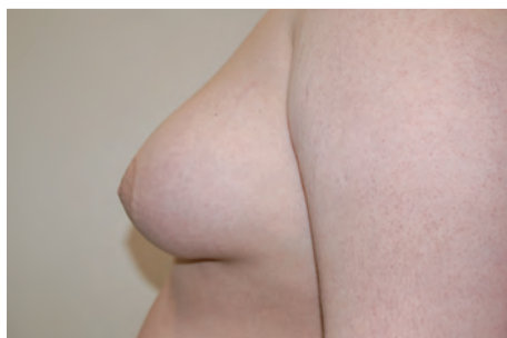
Fot. 3. Mieszana postać ginekomastii.

pełną radykalność zabiegu, dają dobre efekty estetyczne i pozostawiają niewidoczne blizny. Oczywiście, nie każdy pacjent kwalifikuje się do zabiegu małoinwazyjnego. Jedynie te osoby, u których elastyczność skóry pozwala rokować dobre jej obkurczenie, mogą skorzystać z dobrodziejstw tej metody. Najczęściej leczenie jest przeprowadzane w pełnym znieczuleniu (narkozie). Poprzez niewielkie nakłucie skóry długości 3 mm wprowadzana jest najpierw sonda do liposukcji, a następnie przyrząd zwany shaverem (fot. 4). Pozwala on na precyzyjne usunięcie poszczególnych fragmentów gruczołu piersiowego. Podobnie jak to ma miejsce u kobiet przy usuwaniu guzków piersi mammotomem, także tutaj zachodzi możliwość badania usuniętych tkanek pod kątem wykluczenia choroby nowotworowej. Zabieg wymaga dużej finezji ze strony chirurga. Końcówka shavera jest bowiem narzędziem niewybaczającym błędów. Właściwie kierowana przez sprawną rękę chirurga pozwala