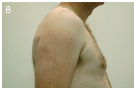
Fot. 6. Przykład ginekomastii mieszanej: A – przed, B – po operacji metodą shave.