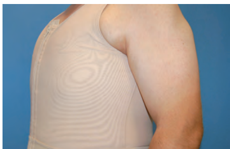
Fot. 5. Strój uciskowy jest stosowany przez 4 tygodnie po operacji ginekomastii.

pełną radykalność zabiegu, dają dobre efekty estetyczne i pozostawiają niewidoczne blizny. Oczywiście, nie każdy pacjent kwalifikuje się do zabiegu małoinwazyjnego. Jedynie te osoby, u których elastyczność skóry pozwala rokować dobre jej obkurczenie, mogą skorzystać z dobrodziejstw tej metody. Najczęściej leczenie jest przeprowadzane w pełnym znieczuleniu (narkozie). Poprzez niewielkie nakłucie skóry długości 3 mm wprowadzana jest najpierw sonda do liposukcji, a następnie przyrząd zwany shaverem (fot. 4). Pozwala on na precyzyjne usunięcie poszczególnych fragmentów gruczołu piersiowego. Podobnie jak to ma miejsce u kobiet przy usuwaniu guzków piersi mammotomem, także tutaj zachodzi możliwość badania usuniętych tkanek pod kątem wykluczenia choroby nowotworowej. Zabieg wymaga dużej finezji ze strony chirurga. Końcówka shavera jest bowiem narzędziem niewybaczającym błędów. Właściwie kierowana przez sprawną rękę chirurga pozwala