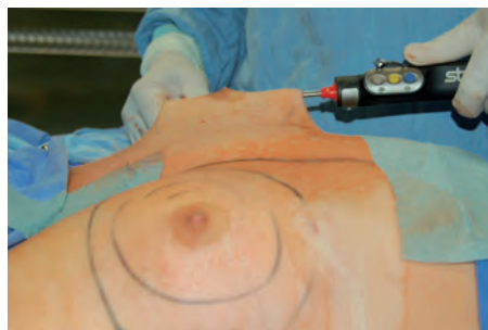
Fot. 4. Operacja ginekomastii z użyciem shavera.

precyzyjnie usunąć nadmiernie rozrośnięte tkanki męskich piersi. Ślady po operacji są minimalne i sprowadzają się do niewielkiej blizny długości 3 mm zlokalizowanej pod piersią. W okresie pooperacyjnym pacjent powinien nosić odpowiednio dobrany strój uciskowy pozwalający na ograniczenie obrzęku i właściwe wymodelowanie skóry (fot. 5). Poniesione trudy nagradza widok kształtnego męskiego torsu (fot. 6 i 7). Bywa, że zabieg stanowi silną motywację dla pacjentów, by przestawić się na zdrowy tryb życia, kształtujący odpowiednie nawyki