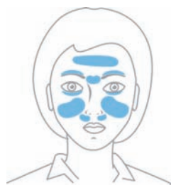
Ryc. 1. Możliwa lokalizacja zmian – skóra okolic głowy, twarzy i oczu. [źródło: https://prodex.proyou.pl/#nuzyca ].

Do najczęstszych objawów nużyczy należą: zaczerwienienie, zmiany grudkowo-krostkowe, łuszczenie. Pacjentom dokuczają często nasilony świąd, pieczenie, a nawet klucie skóry. Zmiany lokalizują się na skórze twarzy, a także z uwagi na obecność gruczołów łojowych i mieszków włosowych, w obrębie brzołów powiek i brwi (Ryc. 1).