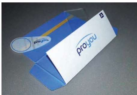
Ryc. 2. Zestaw diagnostyczny Demodex.

Podstawową linią postępowania zapobiegającą zachorowaniu jest przestrzeganie higieny osobistej, niedotykanie twarzy brudnymi rękoma, niekorzystanie z przedmiotów osobistych innych osób, dbanie o dezynfekcję i sterylizację przedmiotów okulistycznych i kosmetycznych. Skoro profilaktyka jest tak ważna, należy także podkreślić konieczność odpowiedniego oczyszczania skóry twarzy