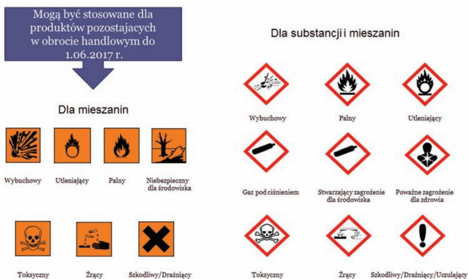
Ryc. 2. Oznakowanie substancji i mieszanin w okresie przejściowym.

Zasady oznakowania chemikaliów regulowane są natomiast rozporządzeniem Parlamentu Europejskiego i Rady, zwanym popularnie CLP. Do 1 czerwca 2015 r. obo-