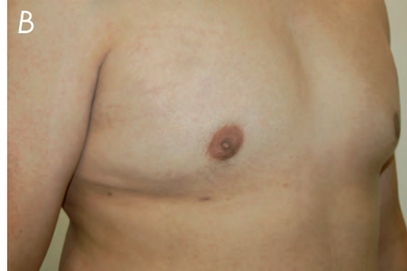
Fot. 7. Przykład ginekomiastii mieszanej; A – przed, B – po operacji metodą shave.

żywniowe i właściwą aktywność ruchową. Wszystko to służy poprawie stanu zdrowia i kondycji mężczyzn. Jak wiemy, nie zawsze