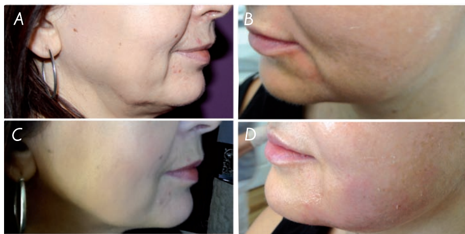
Ryc. 1. Efekty zabiegu zastosowania nici PDO: A, B – przed zabiegiem, C, D – 5 minut po zabiegu.

Nici PDO stanowią alternatywę dla zabiegów chirurgicznego liftingu twarzy i szyi, ale także pomagają korygować niedoskonałości po operacjach plastycznych, takich jak opadająca brew albo dodatkowa wiotka skóra pod podbródkiem.